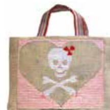
Tête de mort