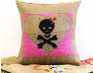
Tête de mort rose