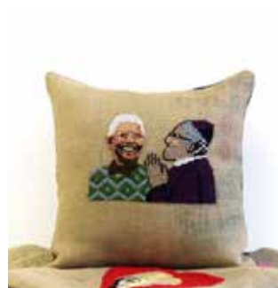
Nelson Mandela & Desmond Tutu