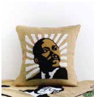
Martin Luther King