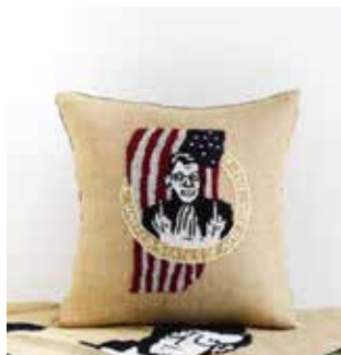
Ruth Bader Ginsburg