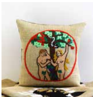
Adam & Eve