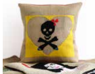
Tête de mort jaune

Chaque motif peut être sur nos housses de coussins ou sur nos sacs en jute.